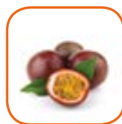
FRUIT DE LA PASSION Bateau Colombie 2 kg