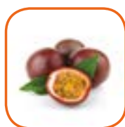
FRUIT DE LA PASSION Avion Vietnam 3 kg / Bqt 2 x 1 kg