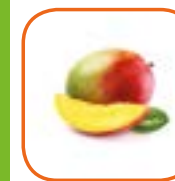
MANGUE Avion KENT Pérou Cal. 8 à 14 6 kg / Girsac 1 kg