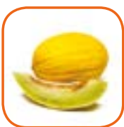
MELON JAUNE HONEY DEW Panama Cal. 3 à 10 10 kg