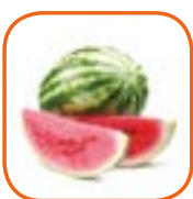
PASTÈQUE QUETZALI Panama Cal. 3 à 6 18 kg