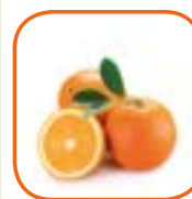
ORANGE VALENCIA Égypte Cal. 48 / 56 / 64 15 kg