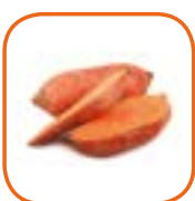
PATATE DOUCE CHAIR ORANGE USA Cal. S à XL 6 kg / 18 kg et barquette