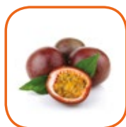
FRUIT DE LA PASSION Avion Vietnam 3 kg / Bqt 2 x 1 kg