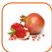
GRENADE WONDERFUL Pérou Cal. 5 à 14 3,8 kg