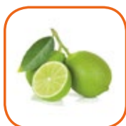
LIME Avion PERSIAN Mexique 2 kg