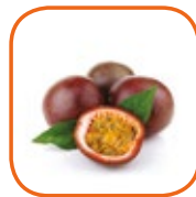
FRUIT DE LA PASSION Bateau Colombie 2 kg