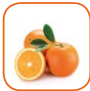
ORANGE VALENCIA Égypte Cal. 48 / 56 / 64 15 kg