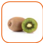
KIWI HAYWARD Italie Cal. 20 à 46 Barquette 1 kg / Plateau 3 kg et 5 kg / Vrac 10 kg et 12 kg