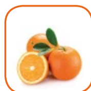
ORANGE SALUSTIANA / WASHINGTON Sanguine Maroc Cal. 4 / 5 / 6 15 kg