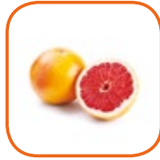
POMELOS STAR RUBY / RUBY RED Turquie Cal. 35 / 40 - 40 / 45 - 45 / 50 - 50 / 55 15 kg