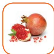
GRENADE WONDERFUL Pérou Cal. 5 à 14 3,8 kg