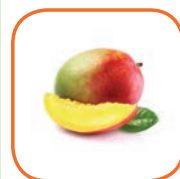
MANGUE Avion KENT Côte d'Ivoire / Mexique Cal. 8 à 14 6 kg