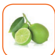
LIME Avion PERSIAN Mexique 2 kg