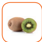
KIWI HAYWARD Italie Cal. 20 à 46 Bqte 1 kg / Plateau 3 kg et 5 kg / Vrac 10 kg et 12 kg