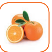
ORANGE MAROC LATE Maroc Cal. 4 / 5 / 6 15 kg bois