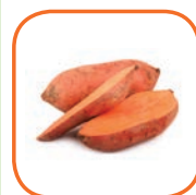
PATATE DOUCE CHAIR ORANGE USA Cal. S à XL 6 kg / 18 kg et barquette