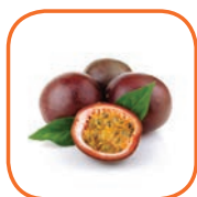
FRUIT DE LA PASSION Avion Vietnam 3 kg / Bqt 2 x 1 kg