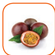
FRUIT DE LA PASSION Bateau Colombie 2 kg